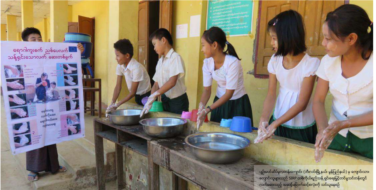
ပျဉ်းမင်ဆိပ်မှလူတန်းကျောင်း (ဘီးလင်းမြို့နယ်၊ မွန်ပြည်နယ်) မှ ကျောင်းသား ကျောင်းသူများသည် SIRP တစ်ကိုယ်ရည်သန့်ရှင်းရေးခြင်းတင်မှုသင်တန်းတွင် လက်ဆေးသည့် အဆင့်မြောက်ဆင့်စလုံးကို သင်ယူနေစဉ်

ယခုလောလောဆယ်တွင် စုပေါင်းအဖွဲ့နှစ်ဖွဲ့၏ အဖွဲ့ဝင်များကြား အသစ်တည်ဆောက်ထားသော မိတ်ဖက်ပြုမှုဖြင့် 'SIRP 2' စီမံချက်ကို စတင်နေပြီဖြစ်ပြီး မြန်မာနိုင်ငံအရှေ့တောင်ပိုင်းဒေသ ဖွံ့ဖြိုးတိုးတက်ရေးအတွက် ဆက်လက်ပံ့ပိုးပေးသွားပါမည်။ ထိုအတွက် ထည့်သွင်းစဉ်းစားရမည့် အဓိကနယ်ပယ်လေးခုကို ပြန်လည်သုံးသပ်ဆန်းစစ်မှုက အကြံပြုထားပါသည်။